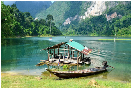
Lac de Chiew Larn